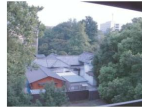
目の前は根津神社♪