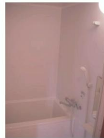
自動お湯張りで湯船に浸かれば 1日の疲れも癒されますね～