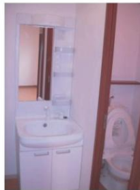
シャンプードレッサー もありますよ♪