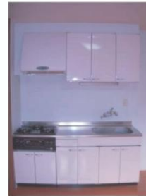
料理するにも便利なサイズ